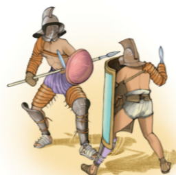
Hoplomaque (à gauche) et mirmillon

Loire aux Pyrénées. Sous les règnes des successeurs d'Auguste, les empereurs Tibère puis Claude, la ville, créée de toutes pièces quelques décennies plus tôt au croisement de la Charente et de deux grandes voies romaines, s'agrandit et s'enrichit de monuments prestigieux comme l'arc de Germanicus, qui marque son entrée est, et l'amphithéâtre, qui borde la cité à l'ouest. C'est sur des terrains proches de celui-ci que les gladiateurs, arrivés en ville quelques jours avant le spectacle, s'entraînent au vu de tous. Les habitants sont donc au courant de toutes leurs particularités le matin du grand jour mais, dans une atmosphère qui doit avoir