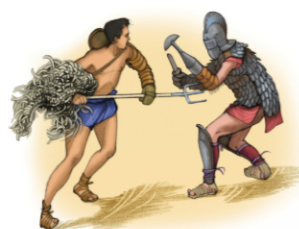
Retiariaire (à gauche) et scissor

quelque chose à la fois du match de Ligue 1, du meeting électoral, du concert de rock et de la soirée de catch, il leur faut attendre jusqu'en début d'après-midi avant de voir leurs champions. Pour les faire patienter, une belle procession le matin marque l'ouverture des jeux, la «pompa». Puis, quand tout le monde est bien installé sur les gradins, les «venationes», des spectacles avec animaux. À midi, pendant qu'on entre et on sort pour se rafraîchir et se restaurer : exécutions des condamnés, mises en scène de façon pittoresque ou mythologique. Enfin arrivent les gladiateurs, qui vont faire vibrer l'amphithéâtre tout au long de l'après-midi, au milieu des cris et des râles.