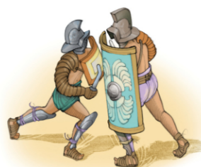
Thrace (à gauche) et mirmillon

Aux premiers temps de l'empire romain, les jours de spectacle, tous les habitants de Mediolanum, capitale des Santons et de l'Aquitaine, pouvaient tenir dans le majestueux amphithéâtre de la ville et vibrer aux combats sanglants qui leur étaient offerts par les magistrats municipaux et les plus riches citoyens.